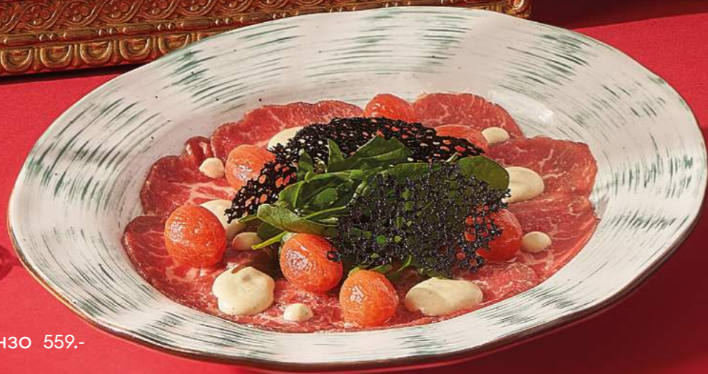
Карпаччо ди манзо 559.-